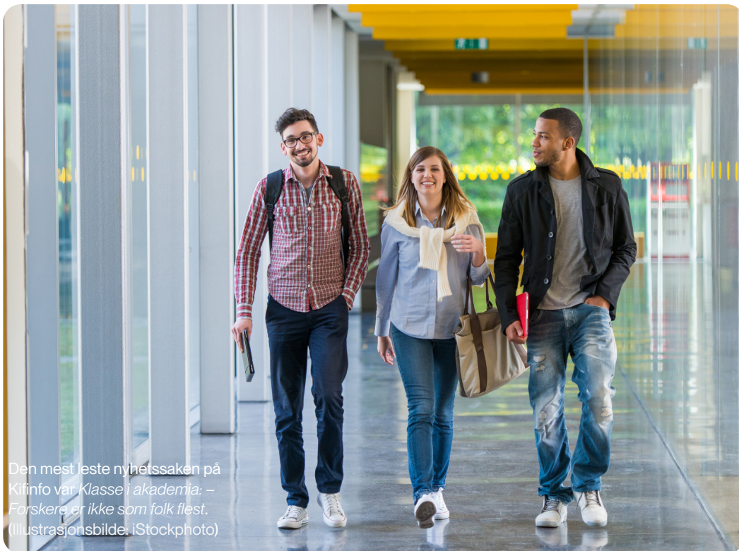
Den mest leste nyhetssaken på Kifinfo var Klasse i akademia: – Forskere er ikke som folk flest. (Illustrasjonsbilde, iStockphoto)

Vi har nær dialog med Kif-komiteens sekretariat, leder og andre medlemmer om aktuelle nyhetssaker og kronikker, og dekker komiteen og dens aktiviteter løpende.